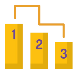
Pozicije ključnih riječi